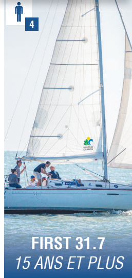
FIRST 31.7 15 ANS ET PLUS