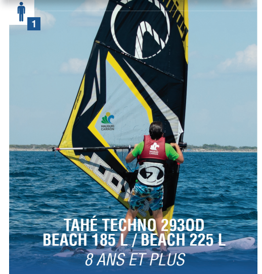
TAHÉ TECHNO 2930D BEACH 185 L / BEACH 225 L 8 ANS ET PLUS