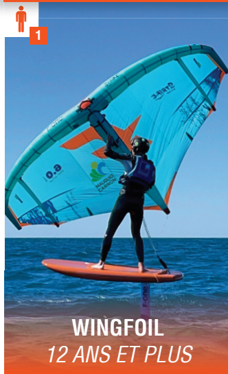
WINGFOIL 12 ANS ET PLUS