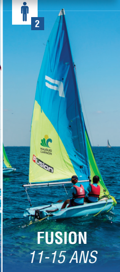
FUSION 11-15 ANS