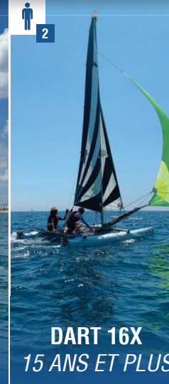
DART 16X 15 ANS ET PLUS