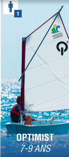
OPTIMIST 7-9 ANS