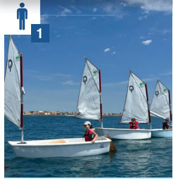
OPTI-KIDDY 6-7 ANS