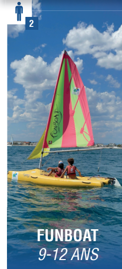
FUNBOAT 9-12 ANS