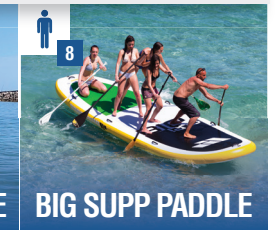
BIG SUPP PADDLE

Naviguez au sein d'un club sportif depuis 1988, un palmarès élogieux, des pros et des champion.ne.s à votre disposition.