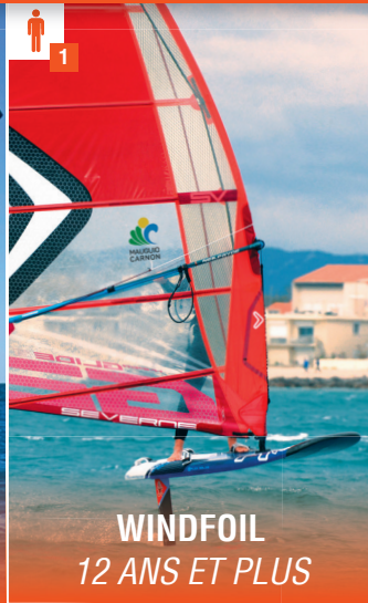
WINDFOIL 12 ANS ET PLUS