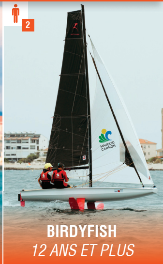
BIRDYFISH 12 ANS ET PLUS